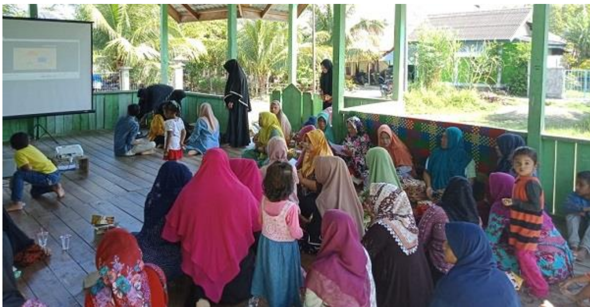
Gambar 2 : Peserta kegiatan mengikuti penyuluhan

rebus. Hal ini diakui oleh seluruh peserta pre-test. Mereka pada umumnya memperoleh kerang dari perairan di sekitar tempat tinggalnya atau membeli dari nelayan di sekitarnya. Bahan tambahan alami yang digunakan untuk merebus kerang pada umumnya hanya garam dapur (97%). Frekuensi konsumsi kerang rebus rata-rata 2 - 5 kali per minggu dalam jumlah sekali makan 1 mangkok untuk seluruh anggota keluarga