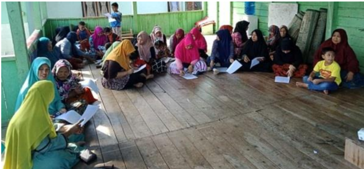
Gambar 1 : Peserta kegiatan mengikuti pre-test

Hasil pre-test menunjukkan hampir seluruh peserta (80%) mengetahui bahwa air laut dapat tercemar dengan adanya komponen asing yang masuk ke dalam air baik secara disengaja atau tidak. Namun terkait dengan Timbal (Pb), hanya sebagian kecil (35%) peserta yang tahu bahwa logam ini adalah logam berat hasil limbah industri yang dapat menyebabkan pencemaran air, logam ini dapat masuk kedalam tubuh manusia melalui makanan hasil laut yang sering dikonsumsi dan berbahaya bagi kesehatan karena dapat menyebabkan gangguan syaraf, gangguan sistem peredaran darah dan gangguan pencernaan. Lebih jauh tentang pencemaran air di sekitar tempat tinggalnya, seluruh peserta (100%) menyatakan bahwa kerang yang mereka konsumsi berasal dari hasil laut yang tidak tercemar. Separuh dari peserta (55%) menyatakan pencemaran air laut tidak berpengaruh terhadap kerang dan tahu bahwa kerang merupakan hewan yang baik dalam menyerap zat kimia yang ada di air. Dalam teknik mengolah kerang, semua peserta sepaham bahwa kerang harus dicuci sampai bersih sebelum direbus dan kerang harus direbus sampai matang. Dan hanya sebagian kecil dari peserta (20%) yang memahami bahwa kerang boleh direbus dengan menggunakan bahan tambahan alami.