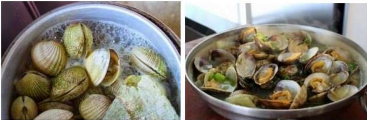
Gambar 3 : Perlakuan sampel 1 dan 2

kondisi yaitu: pada sampel 1; kerang direbus tanpa pemberian sari belimbing wuluh ( Averrhoa Bilimbi ) sedangkan pada sampel 2; kerang direbus dengan pemberian sari belimbing wuluh ( Averrhoa Bilimbi ). Durasi waktu perebusan untuk kedua sampel (1, 2) tidak dibedakan, keduanya dikondisikan hingga mendidih dan cangkang kerang terbuka.