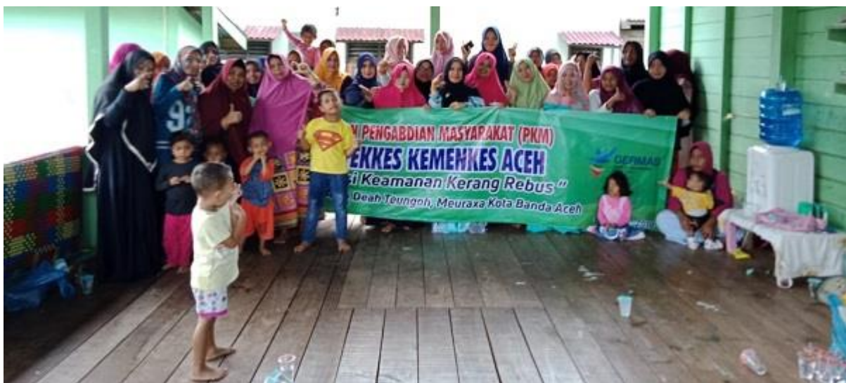
Gambar 5 : Antusias seluruh peserta pengabdian masyarakat

Hasil evaluasi tingkat pengetahuan peserta berdasarkan hasil pos-test menunjukkan adanya peningkatan yang signifikan dari nilai rata-rata 68 menjadi 92. Perbedaan nilai rata-rata pengetahuan peserta tersebut mengindikasikan efektifnya penyuluhan yang telah dilakukan dalam kegiatan pengabdian masyarakat ini. Diharapkan hasilnya dapat disosialisasikan lebih luas oleh para kader yang telah ikut mengsucceskan acara ini.